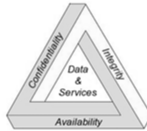
Gambar 1. Prinsip Utama Keamanan Informasi

Dalam konsep keamanan informasi, kita mengenal istilah ancaman ( threats ) yang merupakan setiap peristiwa yang jika terjadi, dapat menyebabkan kerusakan pada sistem dan membuat hilangnya kerahasiaan, ketersediaan, atau integritas. Ancaman dapat menjadi berbahaya, seperti modifikasi yang disengaja terhadap informasi penting seperti dalam perhitungan transaksi atau penghapusan file.