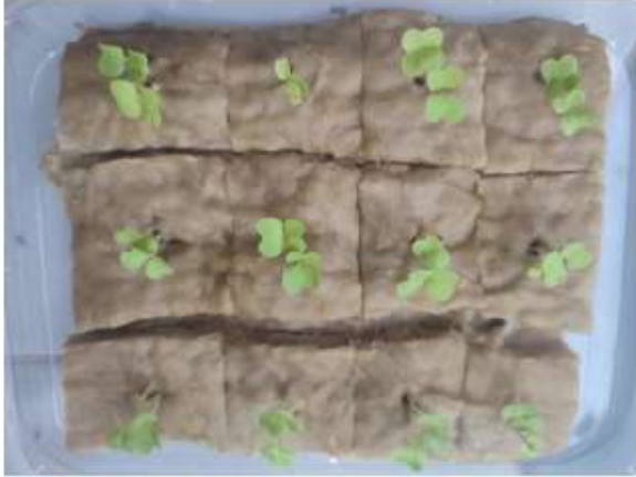
Gambar 7. Bibit waktu 14 hari

Kemudian, setelah bibit pada rockwool disemai dan dirawat selama lebih dari 10 hari dengan memperhatikan kondisi rockwool seperti harus basah, setiap pagi diberi air, serta dijemur pada sinar matahari. Maka, bibit berkembang seperti ditunjukkan pada Gambar 7.