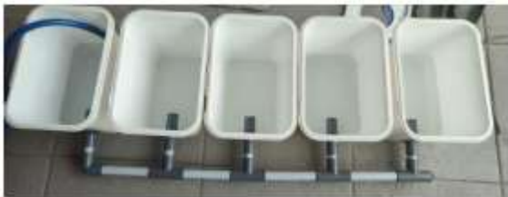
Gambar 3. Skema bucket dan aliran air

Skema pelatihan terkait alat hidroponik yang akan digunakan. Kami memberikan satu set alat untuk sebagai uji coba tanaman menggunakan hidroponik. Pada tahapan awal ini model alat yang digunakan merupakan alat hidroponik yang dibuat dari ember bekas es krim.