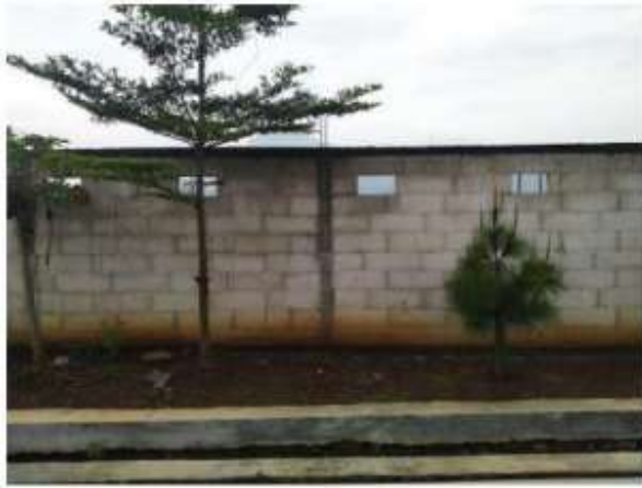
Gambar 1. Lahan kosong

masyarakat dalam memanfaatkan lahan sempit untuk pertanian di perkotaan [5]. Tujuan pemberdayaan masyarakat melalui skema urban farming dapat dimanfaatkan untuk pengalihan fungsi lahan yang tidak digunakan untuk dapat digunakan dalam bercocok tanam. Banyak lahan kosong yang belum dimanfaatkan oleh warga seperti pada Gambar 1