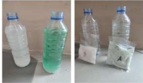
Gambar 5. Nutrisi hidroponik

Pada tahapan kedua adalah menyiapkan tanaman dan nutrisi yang akan digunakan. Untuk tanaman ada dua yang disiapkan adalah pakcoy dan selada. Untuk nutrisi kami menggunakan dua nutrisi yaitu nutrisi A dan B. Masing – masing nutrisi akan dicampurkan sesuai dengan kebutuhan. Proses pencampuran nutrisi dan nutrisi yang digunakan terdapat pada Gambar 5.