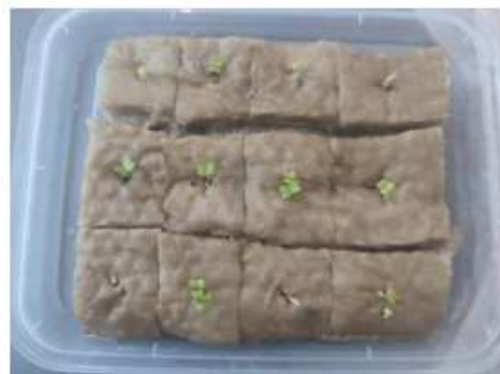
Gambar 6. Bibit waktu 2 hari

Untuk proses pembibitan kita memberikan pelatihan dengan memanfaatkan media bibit menggunakan rockwool. Bibit tanaman yang sudah dipersiapkan kemudian dimasukan kedalam rockwool yang telah disiapkan. Gambar 6 merupakan saat bibit tanaman sudah berumur sekitar 2 – 3 hari didalam rockwool.