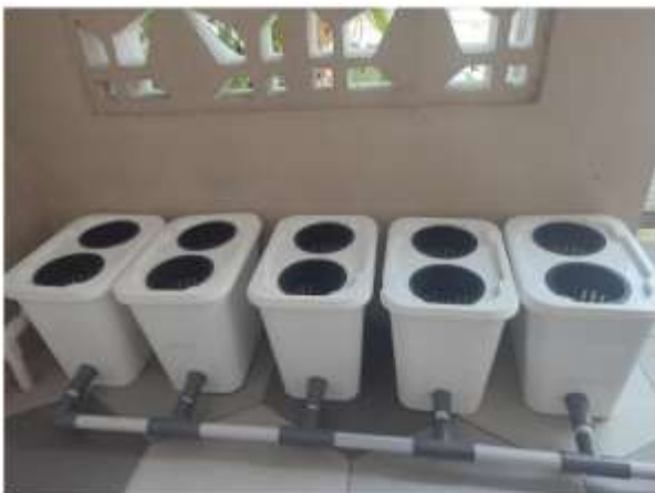
Gambar 4. Skema alat hidroponik

Gambar 3 merupakan desain bucket untuk hidroponik yang akan digunakan. Air yang digunakan akan dialirkan ke setiap bucket yang telah disediakan.