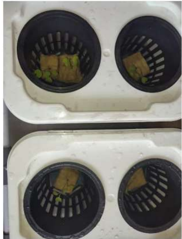
Gambar 8. Penyimpanan tanaman kedalam netpot

Setiap pagi, bucket hidroponik akan dicek dan diberikan oksigen dalam airnya untuk memastikan tanaman tidak mengalami kekurangan atau bahkan kekeringan.