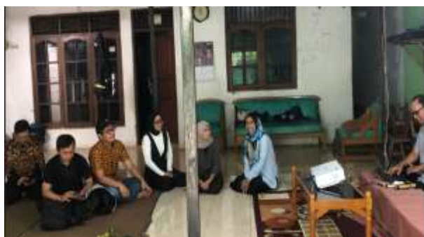
Gambar 5. Suasana Para instruktur menyiapkan dan mempresentasikan materi

Pada gambar 4, menunjukkan salah satu bentuk output rekap laporan bulan. Pada laporan rekap ini, terdapat dua jenis rekap laporan. Laporan rekap kependudukan dan laporan rekap layanan di tingkat RT/RW. Yang membedakan output laporan rekap ini adalah user yang digunakan, apabila user yang login /menggunakan sistem berada pada level RW, maka data yang dapat dilihat adalah seluruh rekap laporan di RT yang berada pada RW tersebut. Sehingga pengurus RW dapat memonitoring kegiatan layanan yang diberikat disetiap tingkat RT. Akan tetapi apabila user yang digunakan untuk login /masuk ke dalam sistem levelnya RT, maka hanya dapat melihat data rekap laporan di RT bersangkutan saja.