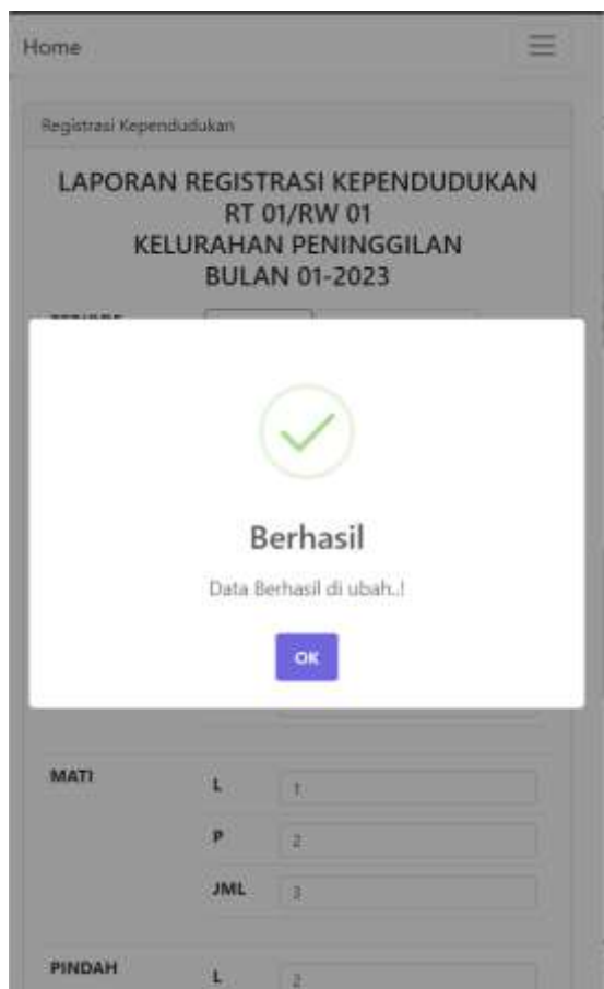
Gambar 2. Halaman Rekap Data Kependudukan

Pada gambar 2, menunjukkan tampilan rekap data kependudukan. Pada menu ini, akan selalu menampilkan data jumlah penduduk pada bulan sebelumnya. Sehingga pengurus RT/RW hanya perlu menambahkan data kependudukan tambahan, misal jumlah lahir, jumlah penduduk yang datang. Pada halaman ini juga, pengurus RT/RW dapat menambahkan informasi berkaitan kepemilikan KTP, baik yang sudah memiliki ataupun belum dan wajib memiliki KTP. Selain data yang sifatnya menambah jumlah warga di RT/RW, juga ada data yang sifatnya mengurangi misal jumlah warga yang meninggal/mati atau jumlah warga yang pindah. Sehingga sistem akan selalu mengkalkulasi jumlah saat ini, yaitu jumlah penduduk sebelumnya di tambah dengan yang lahir atau datang maupun dikurangi dengan jumlah penduduk yang pindah atau meninggal.