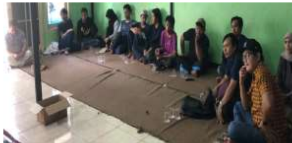
Gambar 6. Suasana peserta pelatihan pengabdian kepada masyarakat

komputer/ Laptop maupun melalui mobile dengan memanfaatkan Browser yang ada di smartphone . Kemudian instruktur juga menjelaskan penggunaan serta fitur apa saja yang terdapat pada sistem aplikasi pengelolaan laporan rekap bulanan di tingkat RT/RW kelurahan paninggilan ciledug.