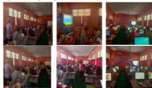
Gambar 2. Kegiatan Pelatihan Hari Berikutnya

Dokumentasi kegiatan pelaksanaan hari berikutnya dapat di lihat pada gambar 2.