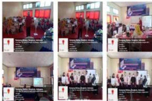
Gambar 1. Foto Kegiatan Pelatihan

melakukan editing video , dan banyak variasi yang bisa dilakukan untuk menghasilkan video yang bagus. Blending mode dalam VSDC ini sangat membantu dalam bermain-main dengan beberapa video sehingga bisa menghasilkan manipulasi video yang menarik, selain itu ditambahkan juga filter video dengan style instagram filter dan ini bisa sangat membantu dalam memberikan nuansa tertentu pada video . Dokumentasi foto kegiatan pelatihan dapat di lihat pada gambar 1.