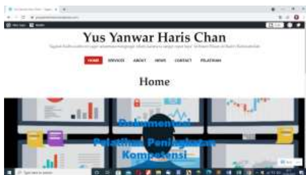
Gambar 11. Hasil Evaluasi yang dikerjakan peserta