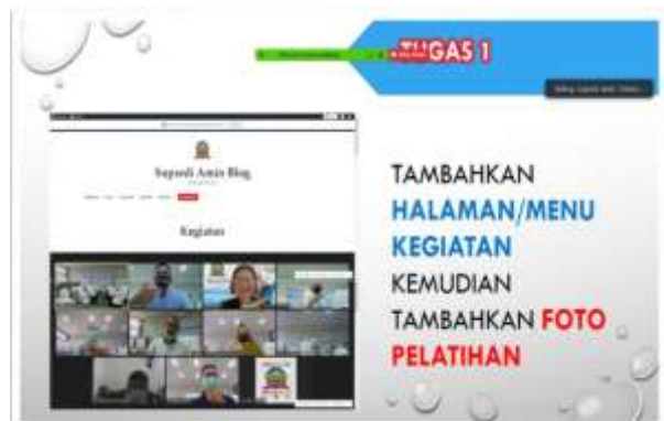
Gambar 7. Pemberian tugas ke peserta

Pada hari ke-4, peserta diberikan materi bagaimana cara merancang user interface . Peserta diberikan tugas untuk menambah halaman atau menu kegiatan serta menambahkan foto dari web yang sudah dibuat dapat dilihat pada gambar 7.