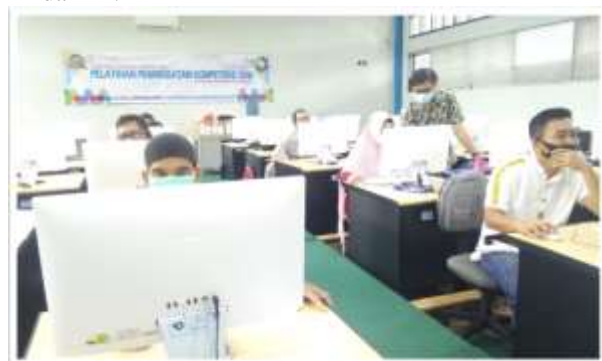
Gambar 10. Evaluasi Peserta

Pada hari ke-5, setelah dilakukannya penyampaian materi dan praktik secara daring selanjutnya dilakukan evaluasi terhadap peserta yang dilaksanakan di laboratorium UPT Sistem Informasi Polman Babel secara tatap muka/offline dapat dilihat pada gambar 10, 11 dan 12.