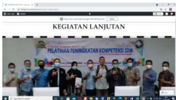
Gambar 9. Hasil tugas yang dikerjakan peserta

Pada hari ke-5, setelah dilakukannya penyampaian materi dan praktik secara daring selanjutnya dilakukan evaluasi terhadap peserta yang dilaksanakan di laboratorium UPT Sistem Informasi Polman Babel secara tatap muka/offline dapat dilihat pada gambar 10, 11 dan 12.