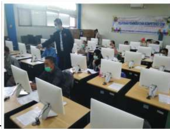
Gambar 3. Instalasi Software

Pada hari ke-2 dapat dilihat pada gambar 3, peserta diajarkan bagaimana cara melakukan instalasi. Peserta diajarkan bagaimana mendownload software yang dibutuhkan yaitu wordpress . Selanjutnya peserta diajarkan bagaimana menginstal software tersebut. Kegiatan instalasi ini dilakukan secara tatap muka/ offline .