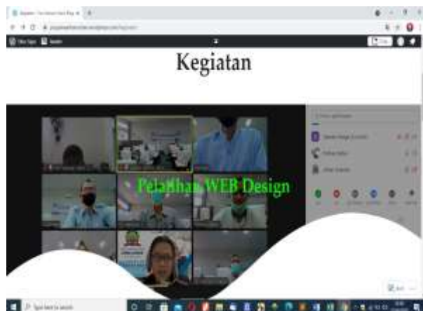
Gambar 8. Hasil tugas yang dikerjakan peserta

Semua peserta bisa mengerjakan tugas dengan hasil yang maksimal dapat dilihat pada gambar 8. Mereka bisa menambahkan halaman atau menu kegiatan serta menambahkan foto-foto kegiatan pelatihan ke website yang sudah dibuat mereka masing-masing dapat dilihat pada gambar 9.