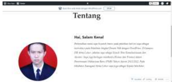
Gambar 6. Hasil akhir tutorial mengupdate/mengubah halaman tentang

dan mengupdate/mengubah halaman kontak dapat dilihat pada gambar 6.