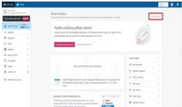
Gambar 4. Selesai proses instalasi wordpress

mulai dengan situs gratis maka selesai proses instalasi wordpress kita dapat dilihat pada gambar 4.