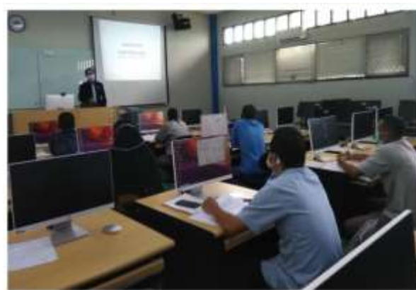
Gambar 2. Penyampaian Materi Dasar Web

persyaratan membuat blog , perbedaan domain , hosting dan server , perbedaan front end , back end dan full stack .