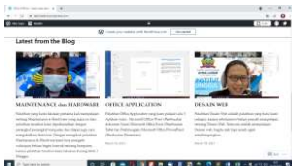
Gambar 12. Hasil Evaluasi yang dikerjakan peserta

Kegiatan pengabdian kepada masyarakat ini dilaksanakan selama 5 hari dengan total waktu selama 65 jam. Adapun kendala yang dihadapi selama pelaksanaan kegiatan pelatihan ini adalah pada tahap awal kami kesulitan mendapatkan peserta yang sesuai dengan persyaratan yang dibutuhkan karena belum ada pengetahuan dasar yang dimiliki peserta sehingga untuk mengatasi hal ini dilakukan kegiatan Pre-Test bagi seluruh peserta untuk mengukur kemampuan individual agar materi yang disampaikan menjadi efektif dan komunikatif. Kami juga kesulitan untuk melakukan penyesuaian jadwal pelatihan dengan jadwal kerja para peserta. Selain itu jaringan internet yang tidak lancar dan sering terputus sehingga menyebabkan komunikasi menjadi tidak lancar saat pelatihan.